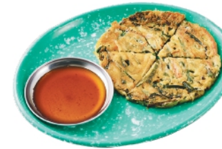
ニラチヂミ ¥660 (税込¥713)