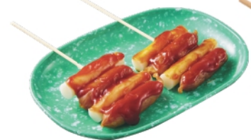
ソットク 甘辛/ケチャップ 1本 ¥260 (税込¥281)