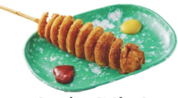
トルネードポテト ¥360 (税込¥389)