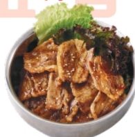
牛カルビ丼 ¥920 (税込¥994)