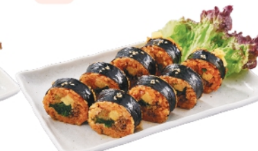
キムチキンパ ¥910 (税込¥983)