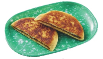
ホットク ¥410 (税込¥443)