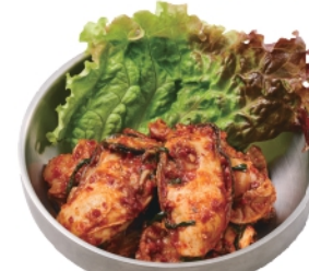
期間限定 大粒牡蠣の海鮮キムチ ¥920 (税込¥994)