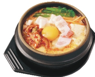
キムチスンドゥブ ¥920 (税込¥994)