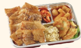
牛豚焼肉弁当 タレ/塩 ¥920 (税込¥994)