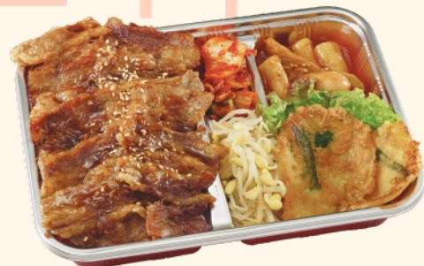
牛カルビ弁当 ¥1,220 (税込¥1,318)