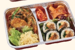
キンパ弁当 ¥900 (税込¥972)