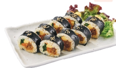
肉キンパ ¥910 (税込¥983)