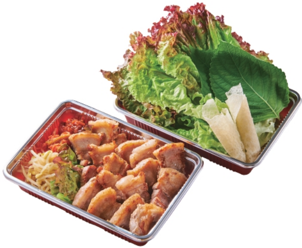
サムギョプサルセット ¥1,050 (税込¥1,134)