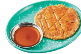
チーズチヂミ ¥710 (税込¥767)