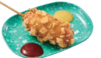
ポテトチーズハットク ¥660 (税込¥713)