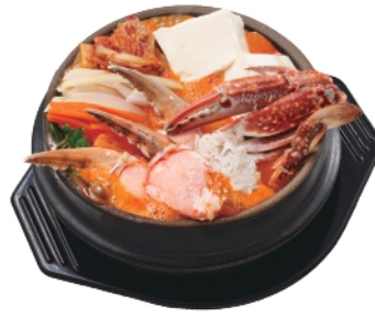
期間限定 蟹スンドゥブ ¥1,320 (税込¥1,426)