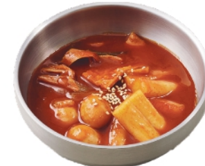
トッポギ ¥460 (税込¥497)