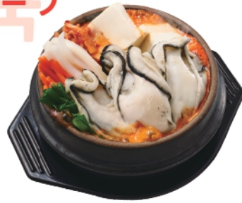
期間限定 大粒牡蠣スンドゥブ ¥1,320 (税込¥1,426)