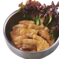
豚丼 ¥770 (税込¥832)