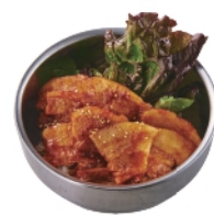
辛豚丼 ¥770 (税込¥832)