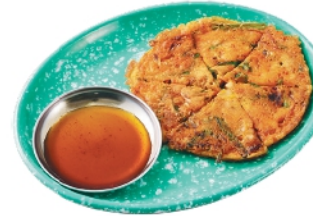
キムチチヂミ ¥660 (税込¥713)