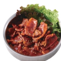
旨辛牛カルビ丼 ¥920 (税込¥994)