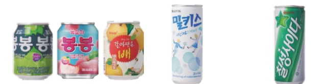
ボンボン ぶどう/もも/なし ミルクス チルソンサイダー