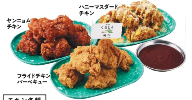
チキン各種 3個 ¥360 (税込¥389) 5個 ¥610 (税込¥659) 8個 ¥910 (税込¥983)