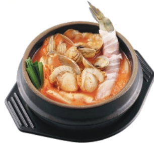
海鮮スンドゥブ ¥1,020 (税込¥1,102)