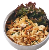
プルコギ丼 ¥770 (税込¥832)