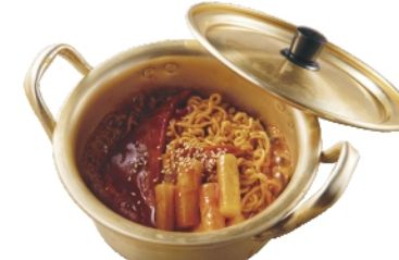
ラッポギ ¥630 (税込¥680)