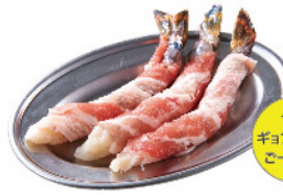
エビギョプサル 1本 ¥450 (税込¥495) くるとん エビを“包む豚”しました。