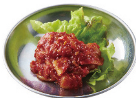
チャンジャ ¥380 (税込¥418)