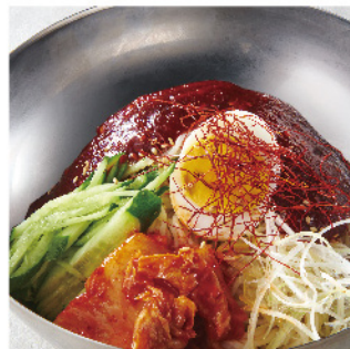
피빔麵 ¥780 (税込¥858)