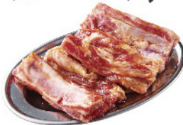
骨付きデジカルビ ¥860 (税込¥946) 骨付きデジカルビ(辛) ¥860 (税込¥946)