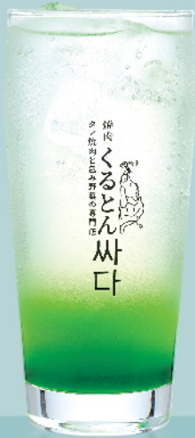
くるとんメロンソーダ