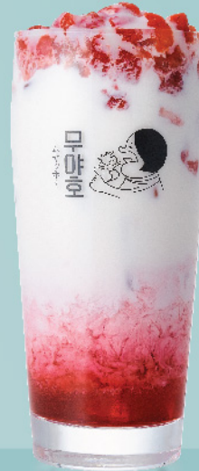
くるとんいちごミルク