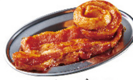
コチュジャン サムギョプサル ¥690 (税込¥759)