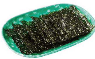
トウルキム ¥300 (税込¥330) 竹塩岩のり。