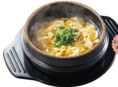
牛カルビ クッパ ¥620 (税込¥682)