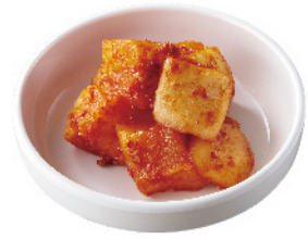
カクテキ ¥380 (税込¥418)