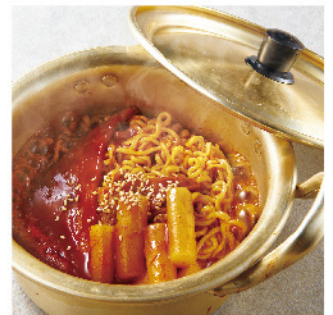
랩포기 ¥620 (税込¥682)