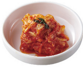
キムチ ¥380 (税込¥418)