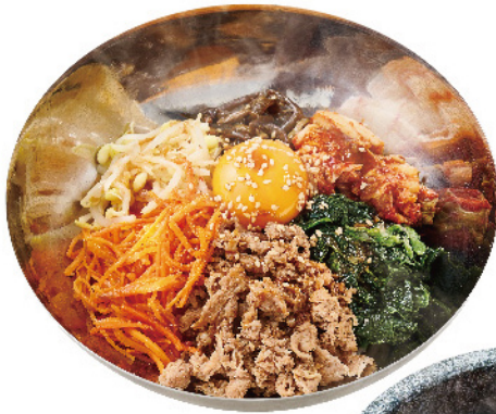
비빔밥 ¥780 (税込¥858)