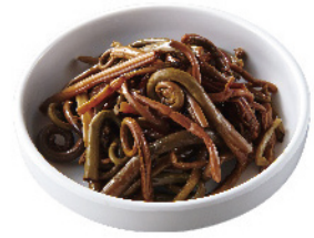
ゼンマイナムル ¥350 (税込¥385)