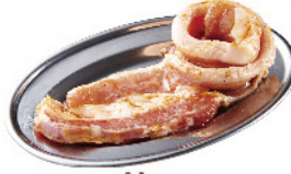
甘口 サムギョプサル ¥690 (税込¥759)