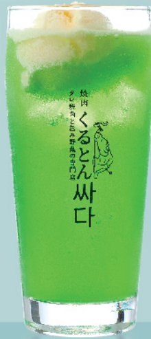
くるとんメロンクリームソーダ