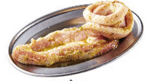
バジル サムギョプサル ¥690 (税込¥759)