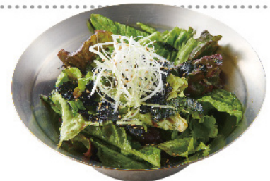
チョレギサラダ ¥680 (税込¥748)