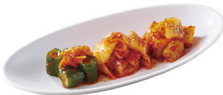
キムチ盛り合わせ ¥650 (税込¥715)