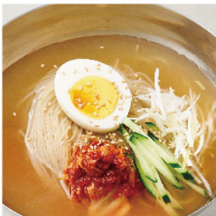
冷麵 ¥840 (税込¥924) ハーフサイズ ¥480 (税込¥528)