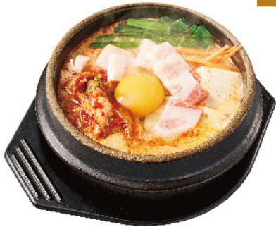
キムチ スンドゥブ ¥900 (税込¥990)