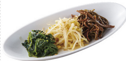
ナムル盛り合わせ ¥550 (税込¥605)