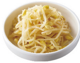
もやしナムル ¥350 (税込¥385)