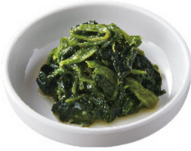
ホウレンソウナムル ¥350 (税込¥385)