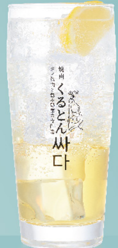
くるとんレモネード