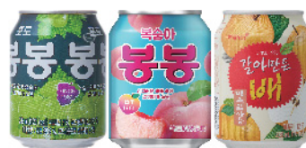
ボンボン ぶどう/もも/なし