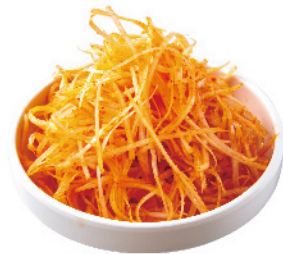
パジョリ ¥400 (税込¥440) 白髪ねぎの旨辛和え。