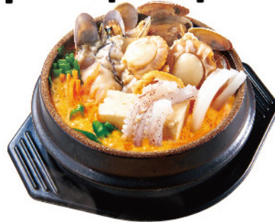
海鮮 スンドゥブ ¥1,000 (税込¥1,100)