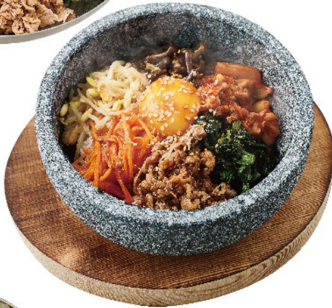
石焼き 비빔밥 ¥900 (税込¥990)