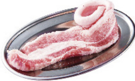
サムギョプサル ¥650 (税込¥715)