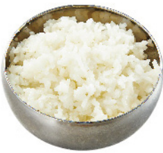
白米 ¥250 (税込¥275)