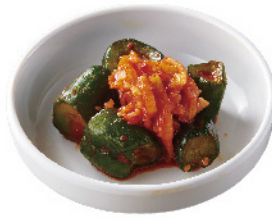
きゅうりキムチ ¥380 (税込¥418)